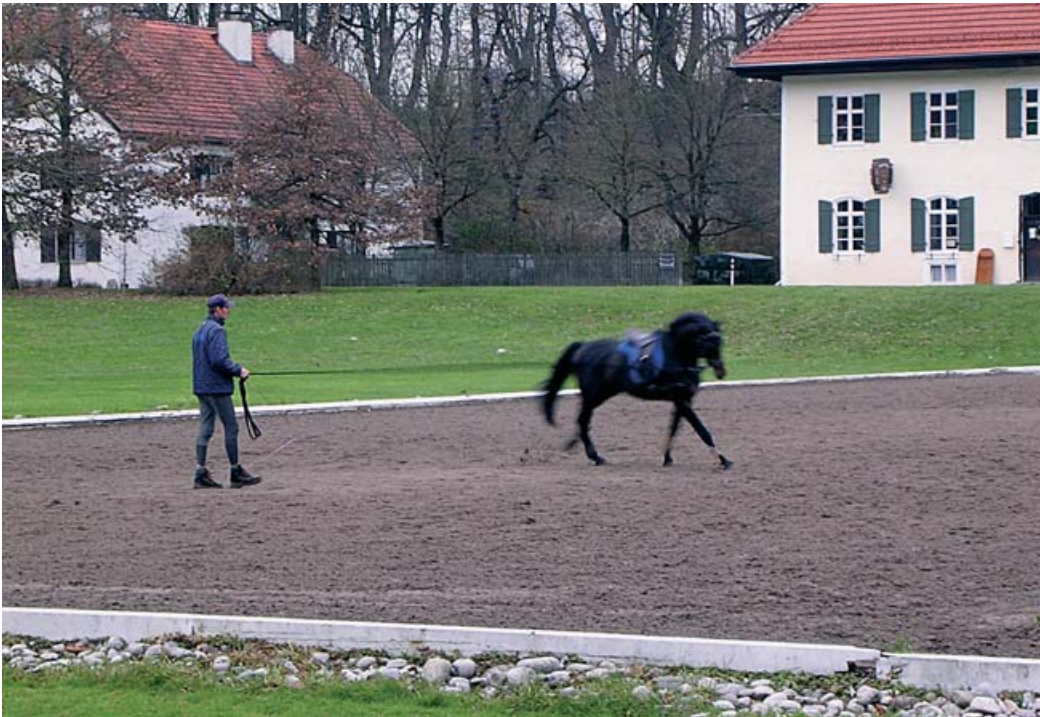
Oritestehin valmistettava ori juoksutuksessa pienellä ulkokentällä.

mannihevosista, Zweibrückenin oreista sekä Clevelandista. Schwaigangerissa vaikuttaa rottaler-ori Elgin. Muut hyväksytyt ovat Mackensen, Moritz, Manketo, Palazzo, Weltenburg. Mielenkiintoisia kuvia ja sukutietoja löytyy www.scherling.org/rottaler.html