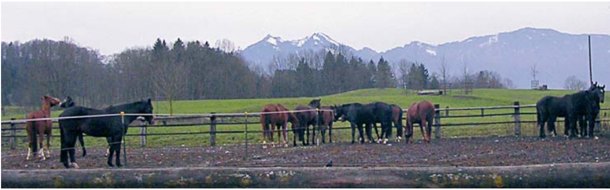
Parivuotiaat pihatossaan Alppien juurella.