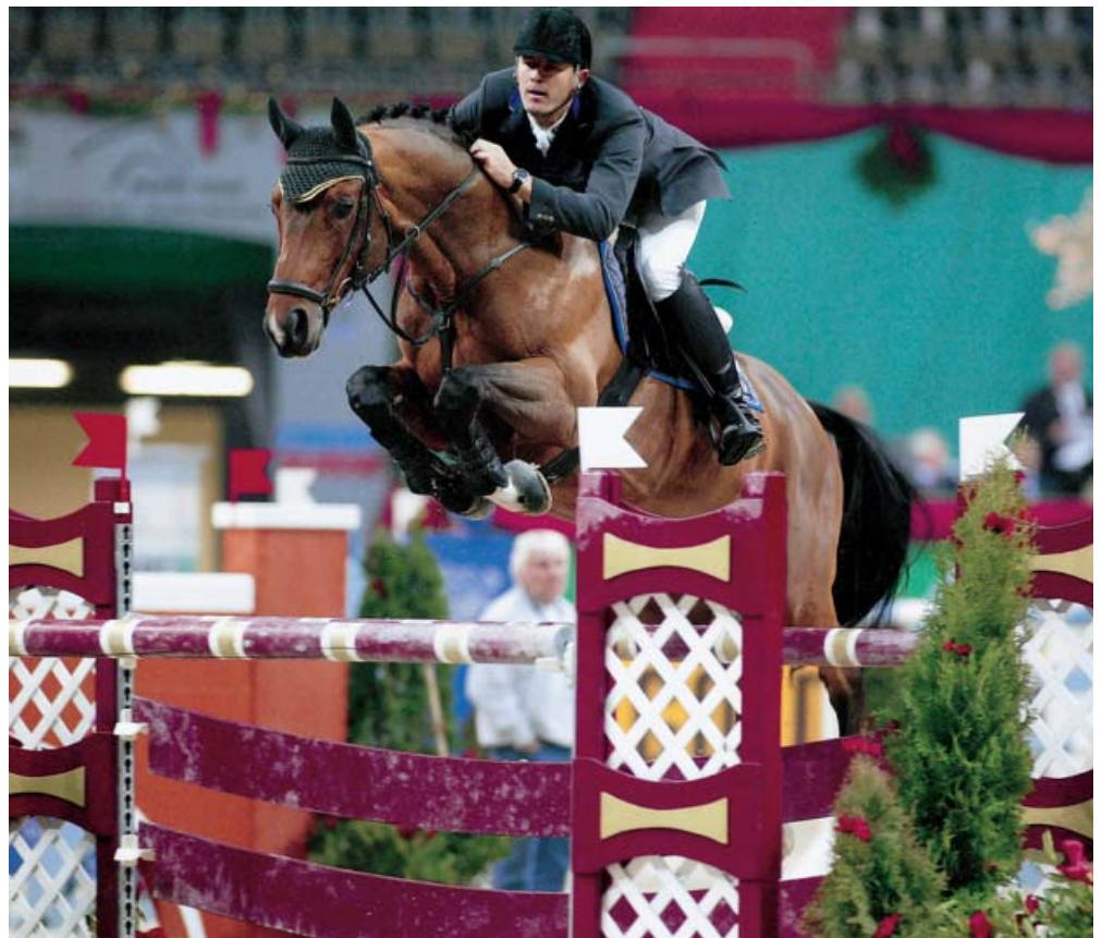
Schwaigangerin ori Asti Spumante menestyy upeasti isoilla esteradoilla.