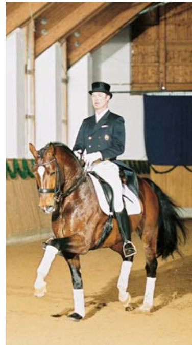
Rivero II kilpailee kouluratsastuksessa vaativissa luokissa.

Kun aiemmin puhuttiin Baijerin lämminverikasvatuksesta, tarkoitettiin sillä yleensä Rottalin hevosta. Rottalin hevonen polveutui alunperin englantilaisista puoliverisistä, nor-