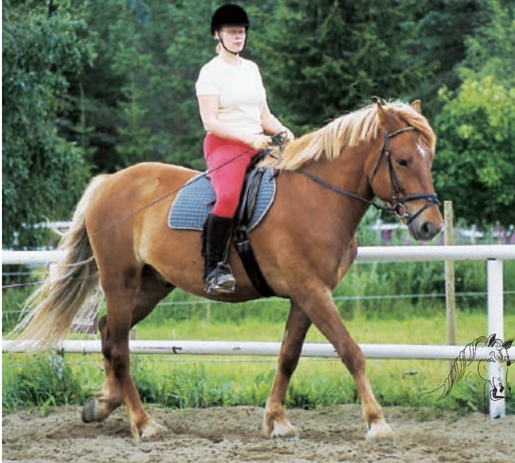
Epun ratsutalli sijaitsee Ukkohallan kupeessa.

Kolme naista on ryhmittäytynyt hevosineen kentälle johtajuusharjoitukseen. Maasta käsin hevosia talutetaan eteenpäin, peruutetaan ja pyydetään väistämään takaosallaan.