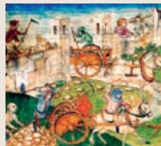
Diebold Schillingin väripiirros vuoden 1484 Bernin Kronikassa kuvaa, miten kaupungin muurien hakatut kivet, katujen sora ja pyöreät nupukivet katupäälysteeksi kuljetetaan hevoskärryillä. Kärryjä vetävät länkivaljailla ja selustimilla varustetut vahvat hevoset. On sekä yhden hevosen kärryjä että parin vetämiä kärryjä, joissa on kätevä kippivarustus kuorman purkamiseen. Free Wikipedia-kuva.