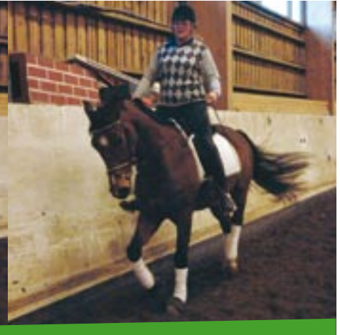
Sari käyttää kääntämiseen johtavaa ohjaa, joka ei jarruta hevosen liikettä kaarteessa.

“Hevosen täytyy saada tasapainottaa itseään kaulallaan”