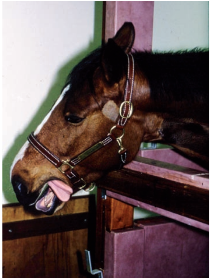
Joskus kipeä hevonen laittaa kielsensä omituisiin asentoihin.

Lisätietoja: www.cvmb.colostate.edu/ivapm/animals/horses.htm , www.vetcare.fi