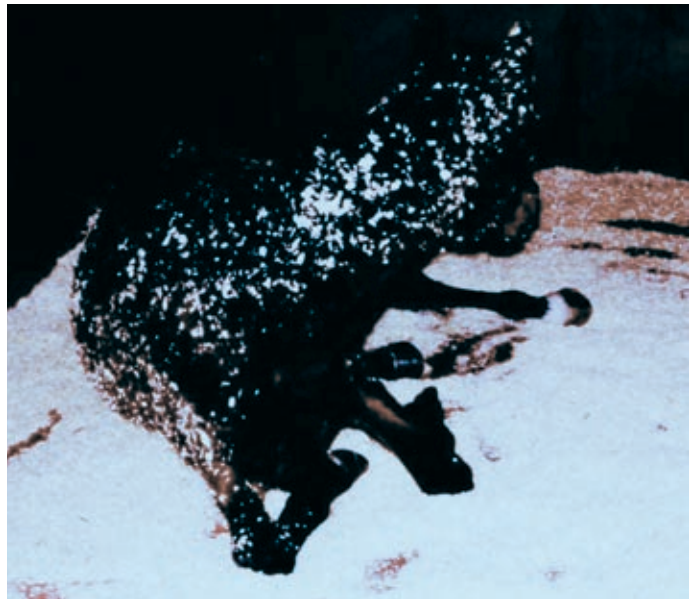
Ähkykipu voi saada hevosen piehtaroiimaan karsinassa levottomasti.

- Akuuteissa tapauksissa vatsan tai sisäelinten vaivoissa hevonen katsoo, puree tai jopa potkii vatsaansa. Vatsanseudun kiristyminen ja kouristelu, poikkeuksellisen ko-