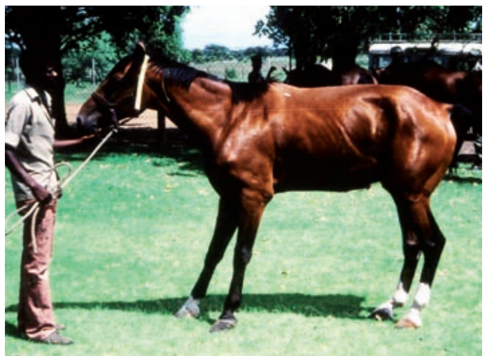
Kaviokuumetta poteva hevonen yrittää siirtää painoaan mahdollisimman paljon takaosalleen.