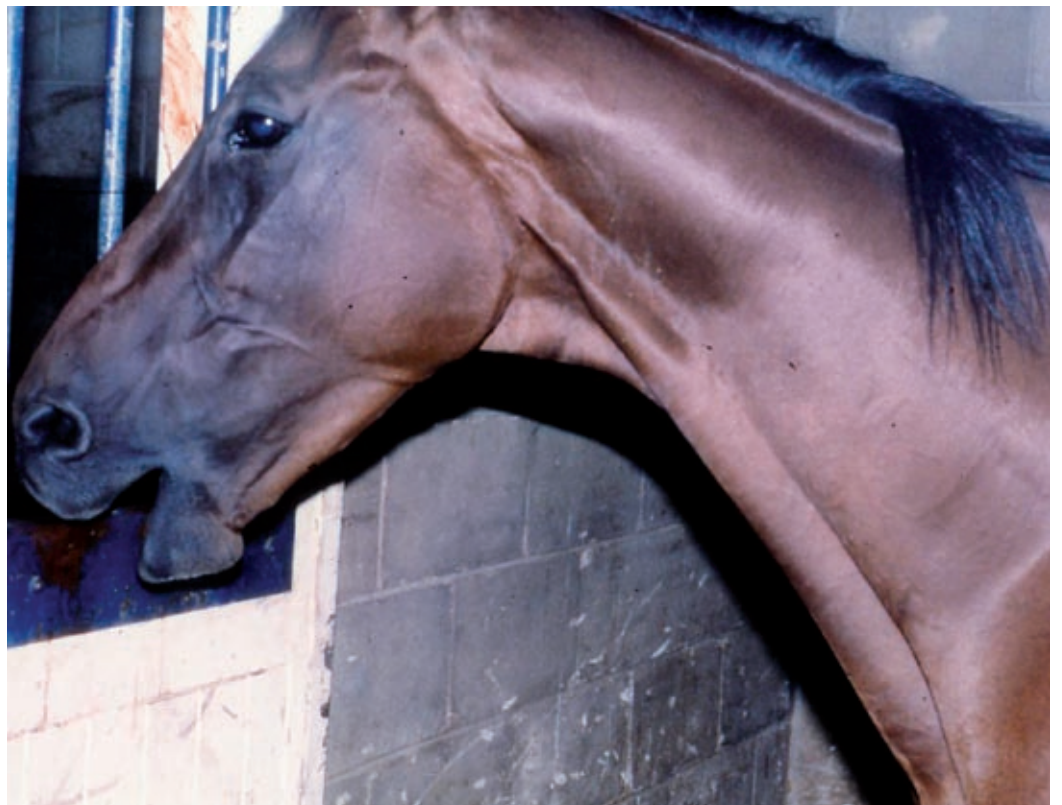
Puun pureminen voi olla oire mahahaavasta. Hevonen yrittää lievittää kipuaan nielemällä ilmaa.