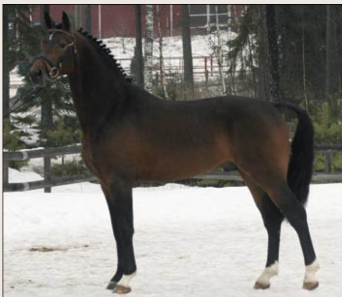
Viisivuotias Lambsdorf edustaa hienoa estesukua. Se on tehnyt viime vuonna Saksassa oritestin ja sen täyssisarukset ovat menestyneet esteradoilla.