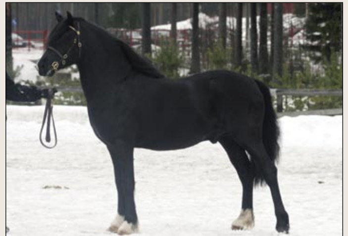
Welsh c-sektion ori Creiglaan Coroeswr on hyväksytty rodun emämaassa Englannissa jalostukseen. Suomessa sille heltisi myös astutuslupa, alkuun kolmeksi vuodeksi.