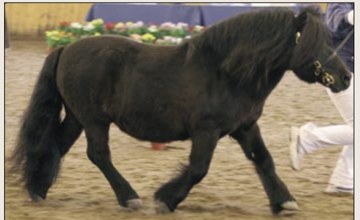
Hollannista tuotu Bonance v. Dorpzicht meni ykkösellä shetlanninponikantakirjaan. Orin rakennearvostelussa oli pelkkiä kahdeksikkoja.