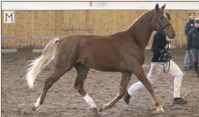
Kolmivuotias Firecape Dito palkittiin I palkinnolla ja hyväksyttiin esitarkastuksessa.