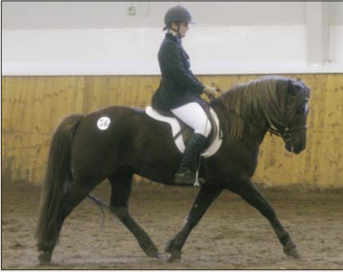
New Forest –ori Nat King Cole sai huimat 42 pistettä ja suoritti ratsastuskokeen hyväksyttävästi.