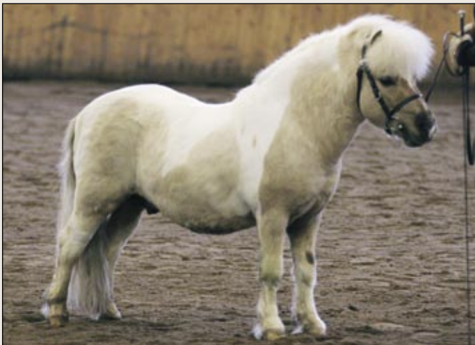
Haljalan Hero on kaunis kuin karamelli ja toimi ajokokeessa moitteettomasti. Ensimmäinen palkinto ja astutuslupa viideksi vuodeksi.

Vanhammista shetlanninponeista uusintatarkastuksessa nähtiin Diplomat ja Korholan Zeus jotka saivat molemmat astutuslupalleen viisi vuotta jatkoa. Jo 25-vuotias Skäpperöds Asterix esitettiin erinomaisessa kunnossa, ja sillekin tuli astutuslupaan viiden vuoden jatko. Peter O'Pan sai tässä vaiheessa vain kolme vuot-