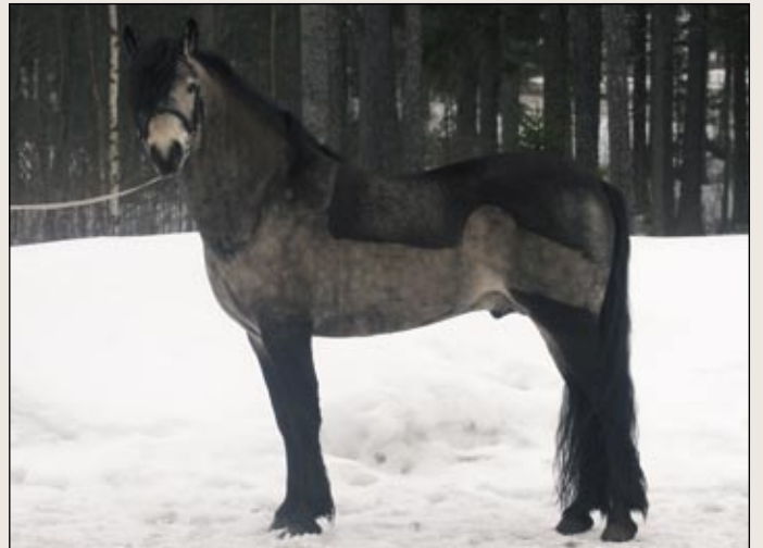
Connemara-kantakirjaan merkitty Rockfield Scarface oli parantunut aikuistuuksaan. Se kantakirjattiin ensimmäisellä palkinnolla.

ma Nat King Cole palkittiin I palkinnolla ja 40 pisteellä samoin kuin Ruotsista ostettu Park´s Tambour. Park´s Tambour on aiemmin hyväksytty Saksassa, Tanskassa ja Ruotsissa ja se on menestynyt kouluradoilla aina EM-kisoissa asti. Suomeen se on ensi sijai-