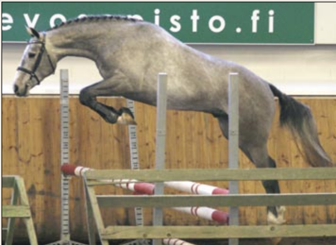
Sammaliston tallin St. Legar hyväksyttiin oriiden esitarkastuksessa ja sille myönnettiin astutuslupa jo tälle kaudelle.

kuperämaassa eli Ruotsissa saadun hyväksynnän perusteella, mutta nyt vasta ori esitettiin suomalaiselle orilautakunnalle. Se sai 41 pistettä ja ensimmäisen palkinnon sekä viiden vuoden astutusluvan.