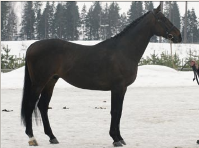
Täysveriori American Patrol xx sai astutusluvan viideksi vuodeksi. Se on nähty kansainvälisillä kenttäradoilla yhden ja kahden tähden kilpailuissa.

jalostuksessa. Se sai nyt 40 pistettä ja ensimmäisen palkinnon sekä viiden vuoden astutusluvan.