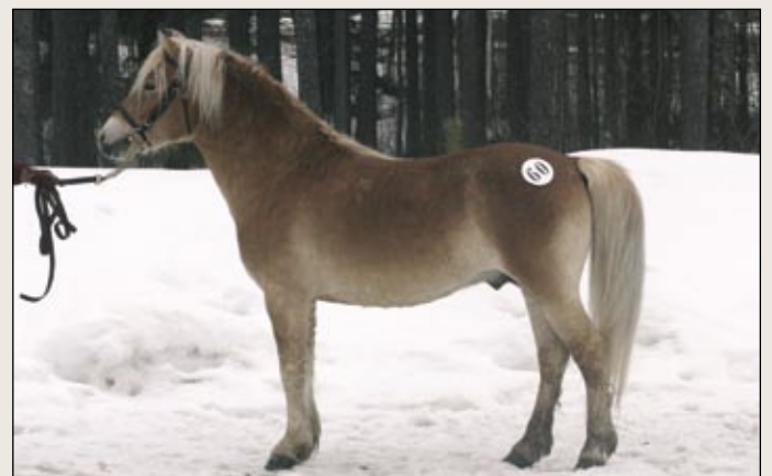
Russ-ori Lustig oli laadukas hevonen, joka toimii niin ratsuna kuin ajossakin.