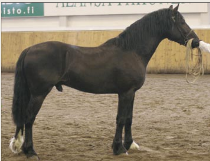
Brudvik Dewin tuo kaivattua uutta verta welsh cob -jalostukseen.