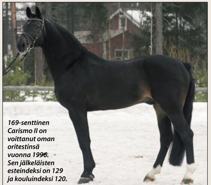
169-senttinen Carismo II on voittanut oman oritestinsä vuonna 1996. Sen jälkeläisten esteindeksi on 129 ja kouluindeksi 120.