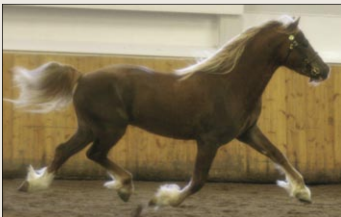
Kotimäen Magician oli 149-senttinen welsh cob, joka palkittiin ykkösellä.