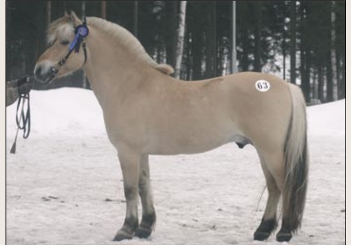
Vuonohevosori Geist Tyler on hyväksytty aiemmin jalostukseen Norjassa, jossa se on myös tehnyt rodun käyttökokeen. Se nähdään jatkossa valjakkoajoradoilla.