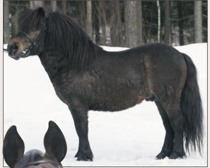
Kolmivuotias A.S. Pablo sai kolmen vuoden astutusluvan.