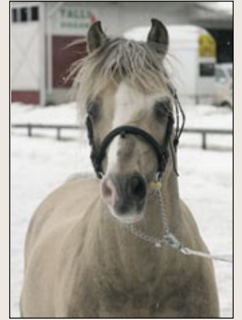
Welsh-ori Steehorst Pride esitettiin uusintatarkastuksessa hyväkuntoisena.