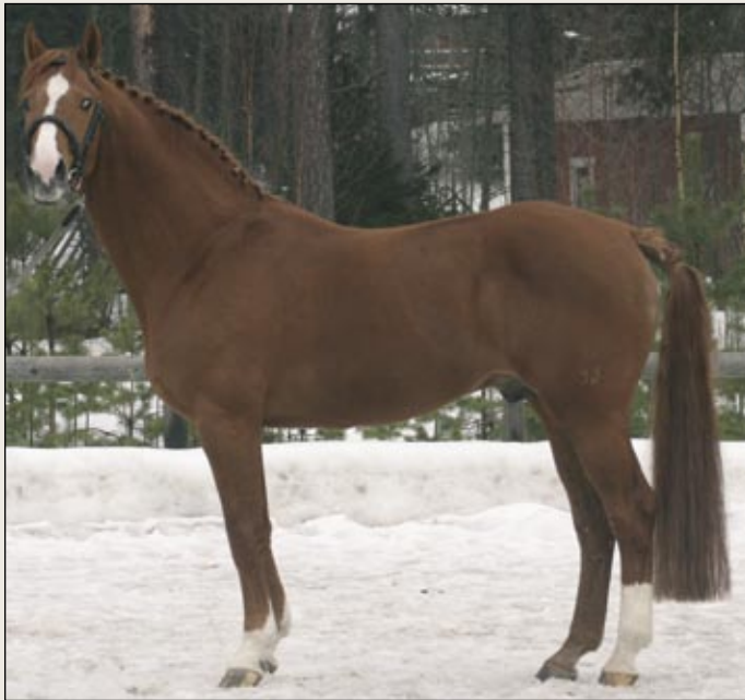
Saksalaissyntyisellä Zapateadolla on hieno jälkeläisindeksi estepuolella, 136. Sillä on Saksassa kaksi jalostukseen hyväksyttyä orijälkeläistä.

Kolmivuotiaista jalostuslupaa hakenneista shetlanninponioureista hyväksyttiin kaksi. Lammenpään Chaplin sai II palkinnon ja kolmen vuoden astutusluvan samoin kuin A.S. Pablo.