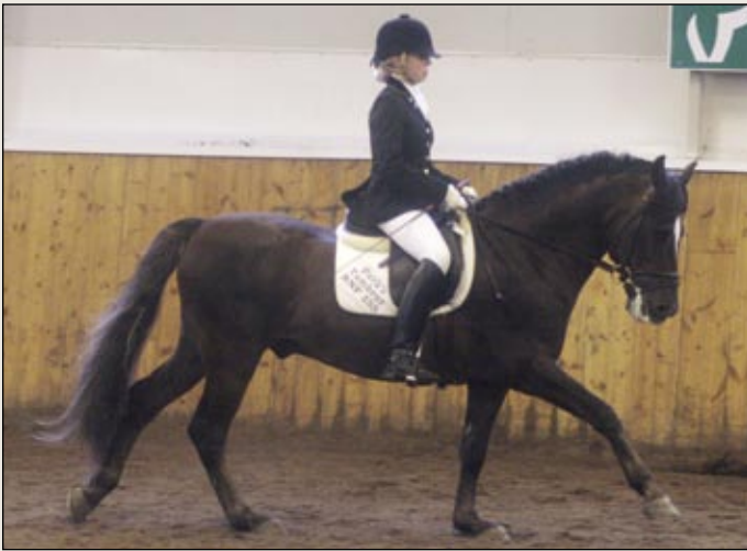
New Forest –ori Park´s Tambour häikäisi kauniilla liikkeillään.