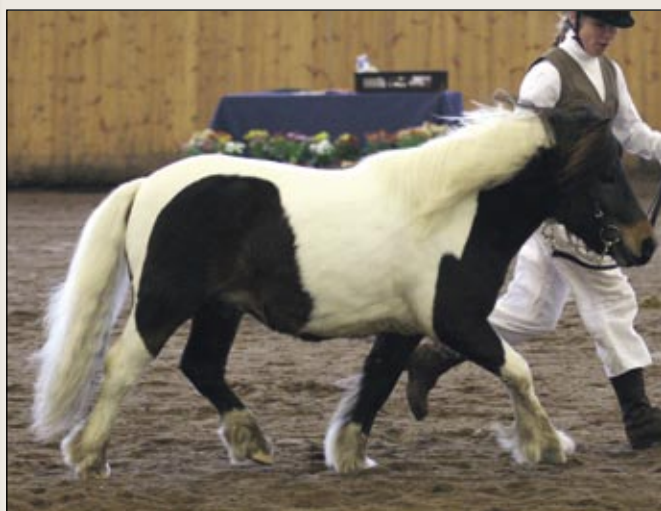
Shetlanniponiori Lamminpään Chaplin sai kolmen vuoden astutusluvan.

Kaikilta oreilta vaaditaan lisäksi hyväksytyt röntgenkuvat ja CEM-testi ennen astutusluvan saantia.