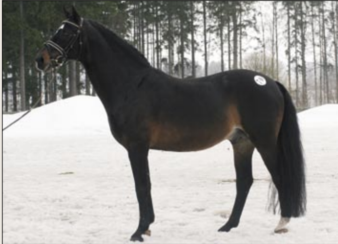
Ruotsalaissyntyinen Master oli odotettu vieras oripäivillä. Oriin ruotsalaiset jälkeläisindeksit ovat ihan omaa luokkaansa: rakenneindeksi 142 ja askellajit 187. Estepuolella Masterin indeksi on vain 76. 18-vuotias ori on itse aikanaan sijoittunut jopa kouluratsastuksen maailmancupin finaaliin.