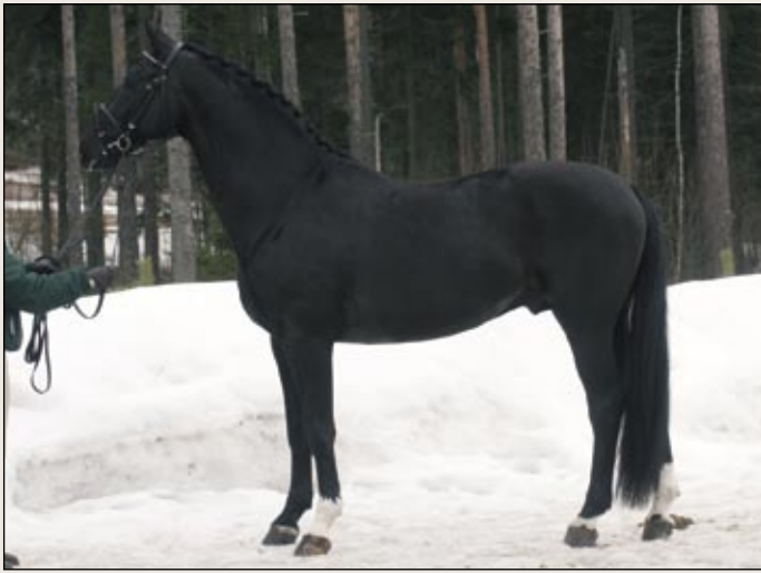
Saksalainen Rosenstolz on Saksassa hyväksytty Oldenburgin ja Mecklenburgin kantakirjoihin. Suomalaiseen kantakirjaan se pääsi ensimmäisellä palkinnolla.