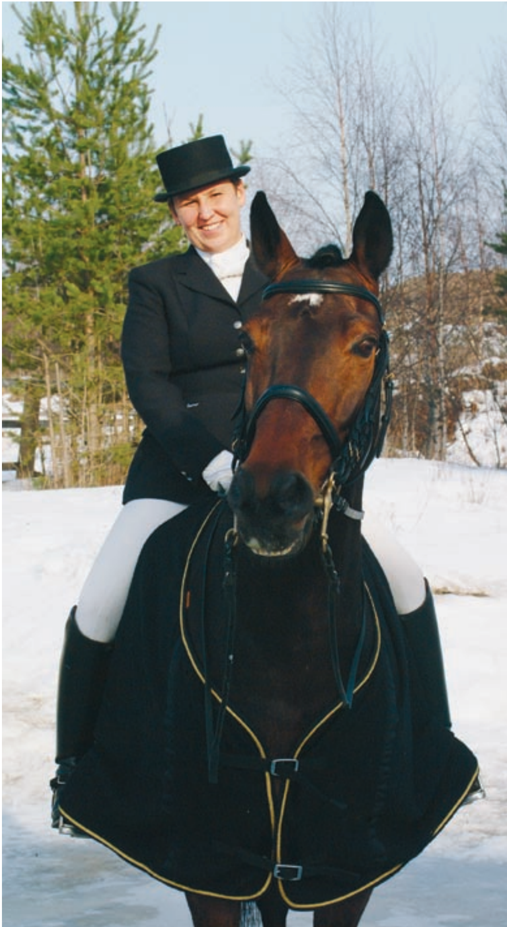
Nurejevin kanssa Meukka on noussut kansalliseen kärkeen. Viime vuonna ratsukko sai liki 200 valiomerkkipistettä.