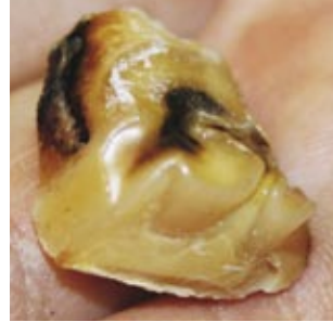
Nellin ylipitkäksi kasvanut hampaan kärki, joka oli pituudeltaan puolitoista senttiä.