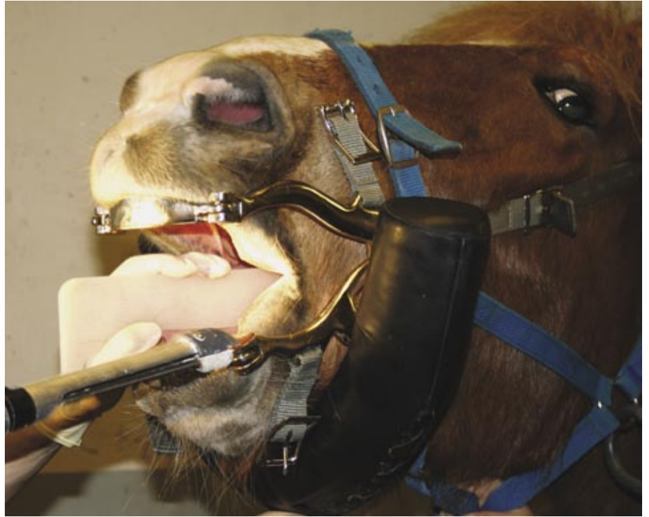
Kielisuojusta käytetään, jos hammasta hiotaan koneellisesti.

osittain mikrobin aikaansaamaa. Se on helppo poistaa mekaanisesti. Ensimmäisellä kerralla näytän täällä klinikalla kuinka se poistetaan. Sitten neuvon omistajia, kuinka he voivat itse tehdä saman jutun vaikka kahvilusikalla.