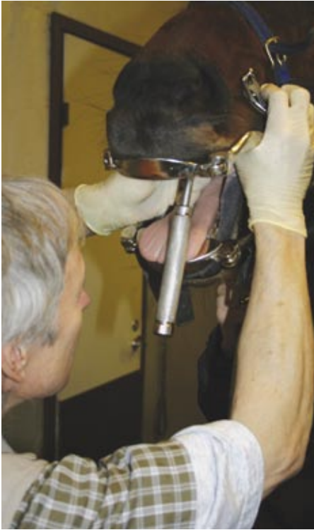
Hammas irtoaa ikenen ja hampaan väliin laitettavan elevaattorin avulla.