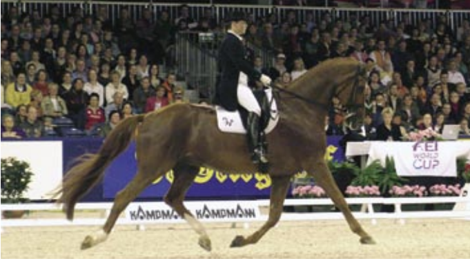
Isabell Werth ratsasti koko finaalin riskirajoilla. Näyttävä suoritus palkittiin kakkostilalla, josta olisi voinut antaa enemmänkin prosentteja kuin reilut 81.