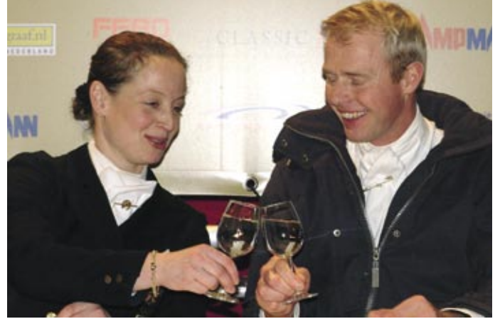
Isabell Werth ja Jan Brink olivat Ankyn pahimmat haastajat Amsterdamissa.

Myös Ruotsin Jan Brink oli tyytyväinen esitykseensä, vaikka jäikin kolmanneksi. Torstain GP-luokan kakkossija antoi aiheen odottaa enemmän, mutta Briar ei ollut aivan parhaimmillaan Amsterdamissa.