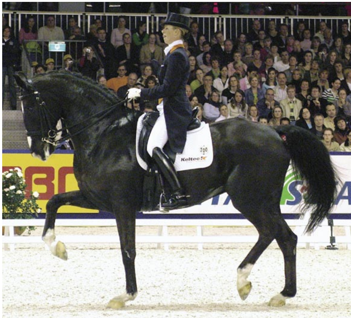
Anky van Grunsven ja Salinero häikäisivät maailmancupin finaalissa.

Anky van Grunsven voitti huhtikuun lopussa kahdeksannen kerran kouluratsastuksen maailmancupin finaalin. Nyt kisapaikkana oli hänen kotikenttensä, ja Ankyn takana oli yleisön ehdoton tuki.