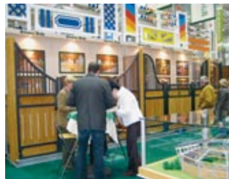
Isompiakin hankintoja oli mahdollisuus harkita messuilla. Laadun tasossa oli paljon vaihtelua, mutta palvelusta ei missään paikassa tingitty.

Messuille on helppo mennä. Lentokenttä on noin vartin ajomatkan päässä messualueesta, joten taksillakaan matka ei ollut kohtuuttoman