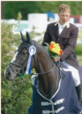
Viron Heiki Vatsel ja Epicuros voittivat torstain 135 cm aikaratsastuksen.