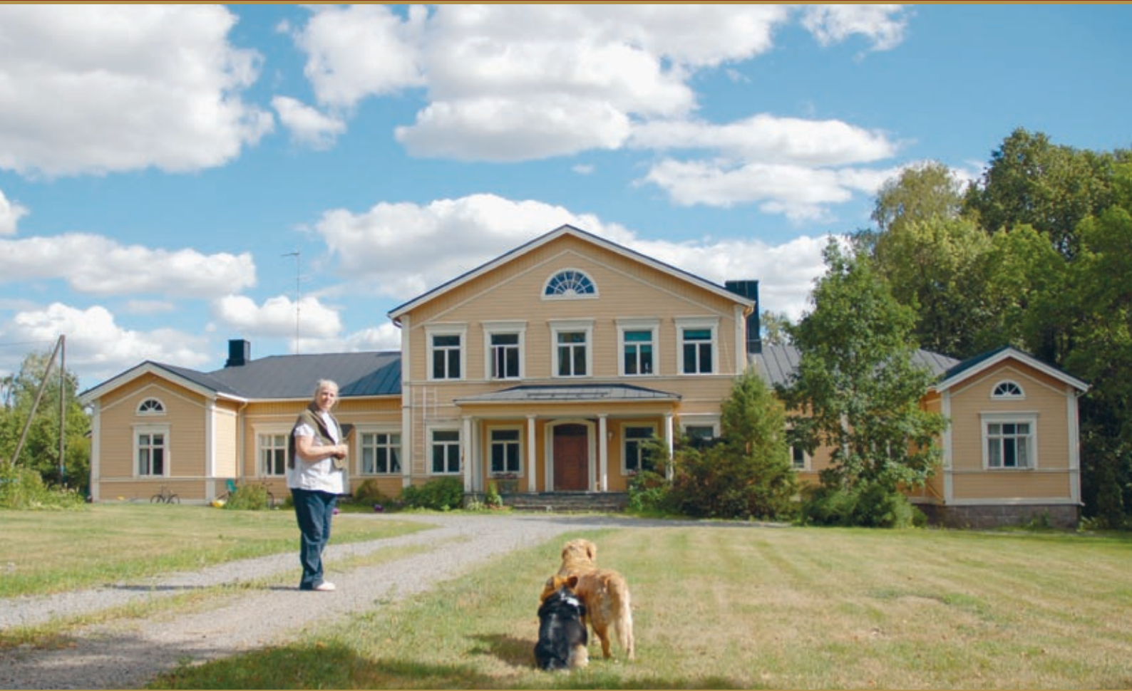
Monikkalan kartano tuli af Enehjelmin suvun omistukseen vuonna 1989.

hemmin kävin perheen asioilla Hämeenlinnassa asti ja jos lehmät olivat aitaamattomilla odelmapelloilla, ratsain lehmipaimenessa. Paimenessa oltiin aamulla ja iltapäivällä noin neljä tuntia kerrallaan.