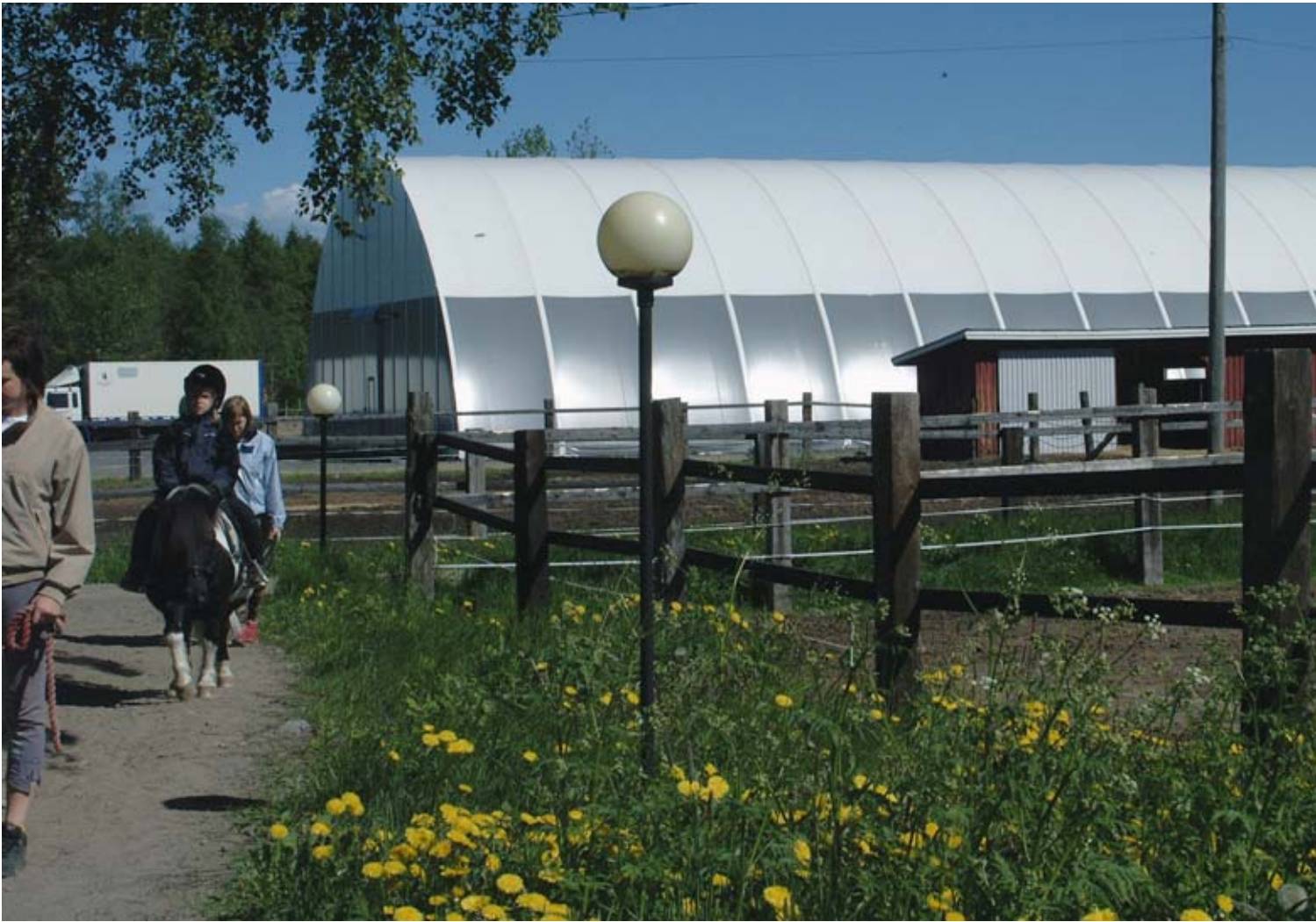
Tilava maneesi hallitsee pihamaisemaa Jaatallilla.