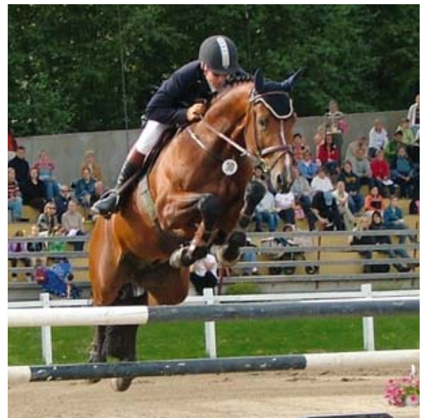
Timo ja Philadelphia T Laaksolla gp-finaalissa.

- Olen kyllä aina tuntenut vetoa hevosiin, mutta en tullut aloittaneeksi ratsastusta kunnolla kuin vasta kolmikymmppisenä valmiina eläinlääkärinä. Olin kaupunkilaispoika eikä mikään ohjannut minua talleille, joten