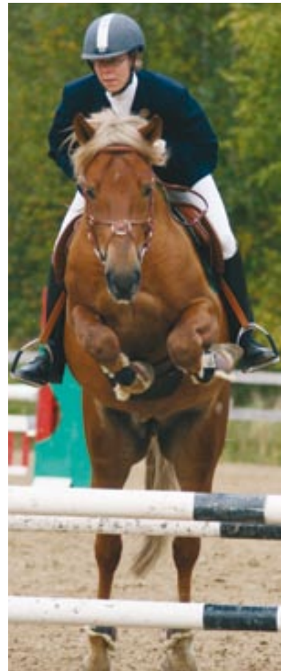
4-vuotias ori Sangen Tuima palkittiin ikäluokkansa parhaana Laatuarvostelussa.