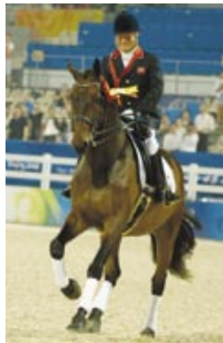
Lee Pearson otti Hongkongissa jo yhdeksännen henkilökohtaisen paralympia mitalinsa. Hän on ollut kolmessa kilpailussa kolmen eri hevosen kanssa, ja aina voittanut.