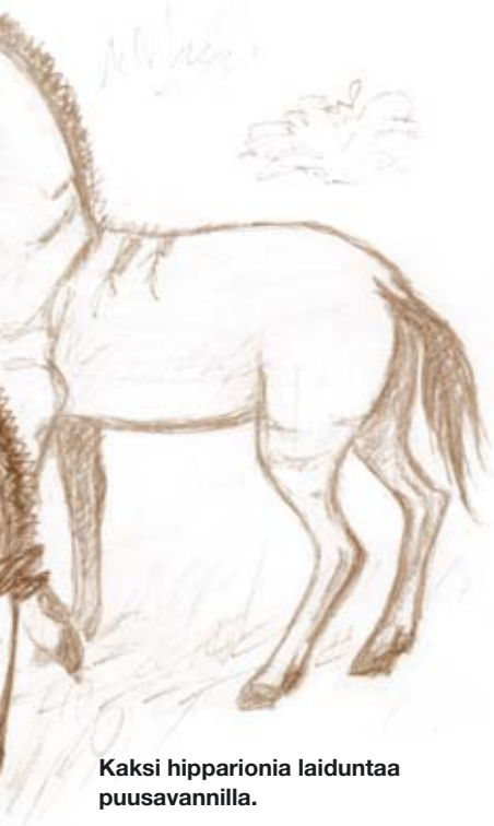
Kaksi hipparionia laiduntaa puusavannilla.

osan hevosen painosta. Joustomekanismi toimii kengurukeppinä: se varastoi iskujen energian ja vapauttaa sen taas seuraavalle askeleelle. Se säästää näin askeleeseen kuluva energiaa.