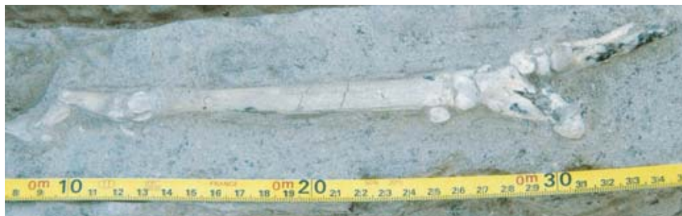
Sinapin neogeenikautisesta sedimentistä löydynt hipparionin ( Cormohipparion sinapensis ) takaraajan alaosa. Kuvassa näkyy pitkä putkiluu ja varvasluut. Sivuarpaat ovat osittain hävinneet fossiilista.

maakin olisi syntynyt pedoilta suojautumiseksi.