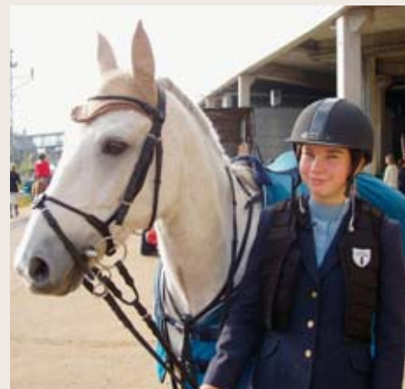
Kalajoelta Helsinkiin matkaneelle Aminonille oli Areenalla paljon ihmeteltävää.

Ami puretaan kopista VR:n varikolla. Utelias poni ihmettelee liikennettä. Verryttelys-