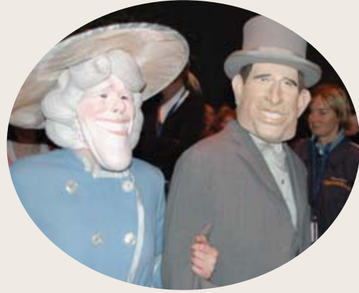
Myös Charles ja Camilla piipahtivat Areenalla

Koti-Suomen kamaralla esiteltiin ensin suomenhevosta eri tehtävissään, minkä jälkeen matkattiin Englantiin Ascotin laukkaradalle. Areenalla syntyi pientä häslinkiä, kun ilman ratsastajia kisaavat shettikset eivät pysyneetkään uralla, vaan pyrkivät oikeaan kaarteissa. Voittaja saatiin kuitenkin kruunattua. Saarivaltiossa tavattiin shettisvaljakolla ajavat Charles ja Camillakin, ihkaelävinä!