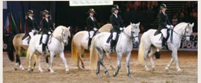
Connemarayhdistyksen "lipizat" esittivät upean katrillin.

Show oli kaiken kaikkiaan onnistunut. Turhia odottelutaukoja ei jäänyt, vaan suuresta hevosmäärästä huolimatta järjestelyt toimivat sujuvasti. Vaihtuva, teemaan sopiva musiikki loi mukavasti tunnelmaa. Matinean kruunasi dalmatialaistarina, joka onneksi päättyi onnellisesti sadan ja yhden pilkullisen ponin riemulaukkaan. •