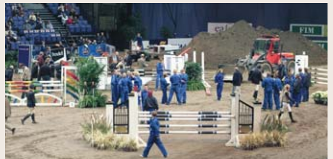
Kaivinkoneet olivat työssä silloin kun kisan olisi jo pitänyt alkaa. Ensimmäisen luokan ratsastajat tutustuivat rataa koneiden keskellä ja iso hiekkakasa nökötti areenalla koko torstai-illan.

nin ansiosta, mutta nyt toisiaan toistavat kommentit "tulin näyttämään hevoselle areenaa ja yritän tässä nyt saada sen rentoutumaan" eivät kauaa jaksaneet yleisöä kiinnostaa. Kiinnostavaa olisi ollut kuulla jotain konkreettisempaa.