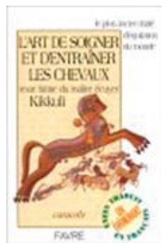
Kikkulin hevosvalmennuskirja on käännetty esimerkiksi ranskankielelle, mutta suomen kielellä hänen oppejaan on julkaistu vain aivan muutama rivi.