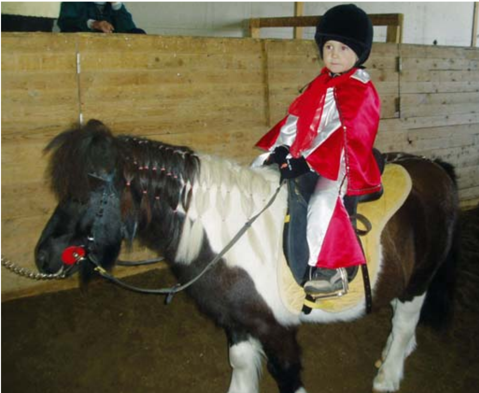
Kisan nuorimpia Elviksiä valmistautumassa suoritukseensa.

Tippaakaan liioittelematta jo legendaksi muodostunut Pohjan Poika -kisa keräsi tänä vuonna ennätysellisen määrän ratsukoita ABC-tallille Haukiputaan Virpiniemeen. Kisaamaan olivat tosin tervetulleita vain komeamman sukupuolen edustajat kuten kisan nimikin antaa ymmärtää.