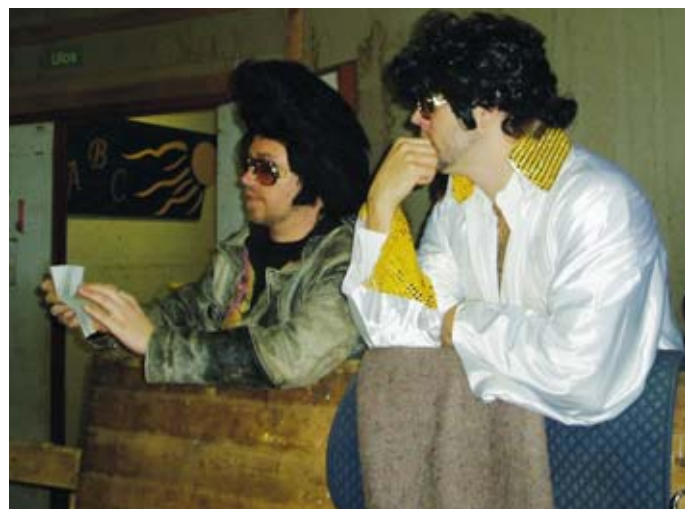
Tiukkaa strategian suunnittelua ennen omaa vuoroa.

Järjestävä seura ei jättänyt valmistautumisessa mitään arvailujen varaan.