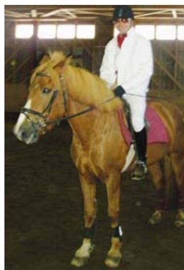
ABC-tallin Jailhouse Jack häikäisi virheettömällä radallaan... ja valkoisissa tightseissaan.

Jotkut miehistä tunnustivat avoimesti miettineensä parikin vuotta mukaan lähtemistä, muutamat olivat "reenailleet muutaman kerran pohjan poikaa varten testimiehellä".