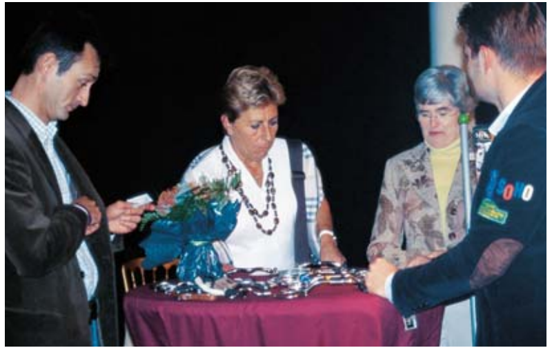
Uudentyyppiset kuolaimet kiinnostivat kouluratsastajia näyttelytiloissa.