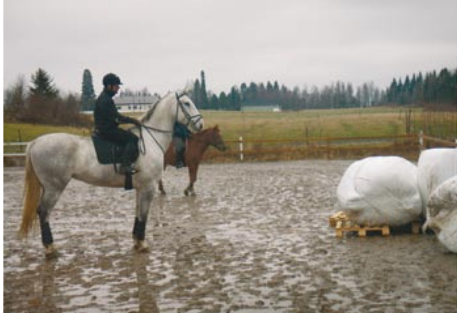
Rymyryhmä on tutustunut käytännössä paitsi mörköjen kohtaamiseen myös mm. juoksuttamiseen, teorialuennoilla hevosen aisteihin ja kotitehtäviä tehdessään esim. terveen hevosen tuntomerkkeihin. Ryhmäläiset hoitavat myös hevoset ennen ja jälkeen tunnin.